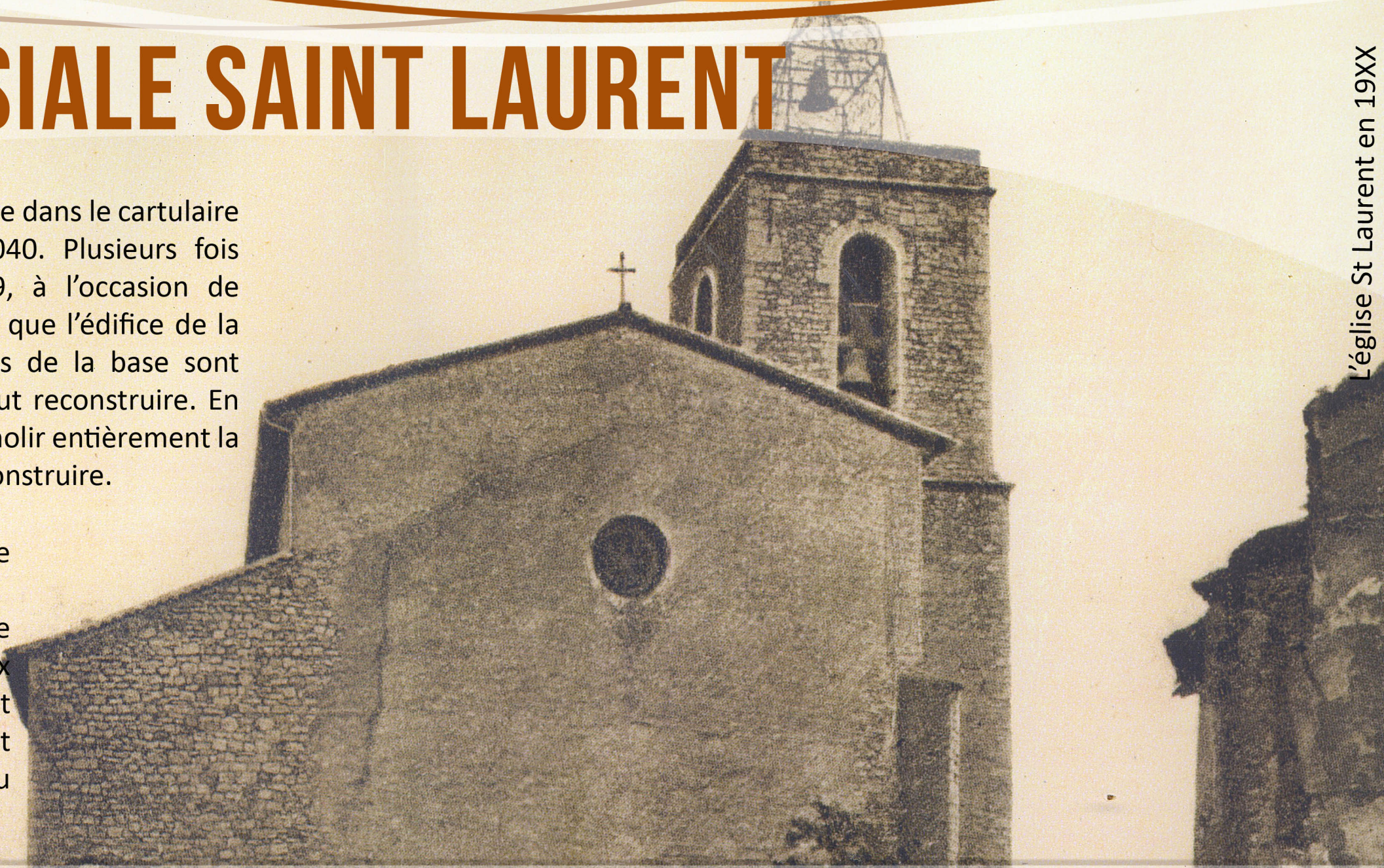
L'église St Laurent en 19XX