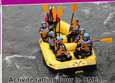
Activité rafting pour le CMEJ...