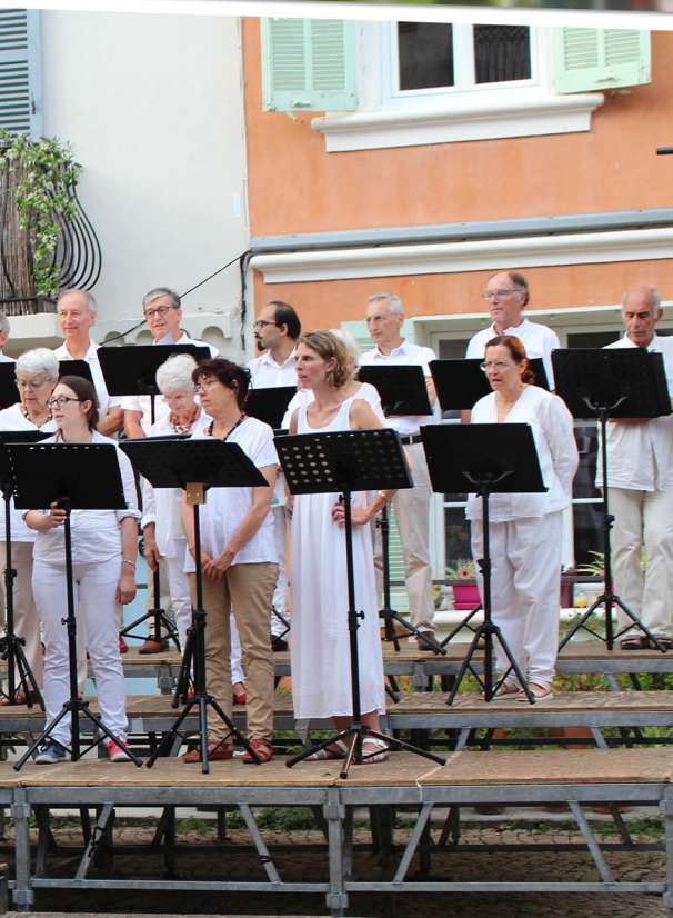
chorales - en haut, l'ensemble Camerata esse - en bas, Monsieur le Maire s'adressant de Draguignan