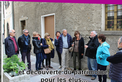
et découverte du patrimoine pour les élus...