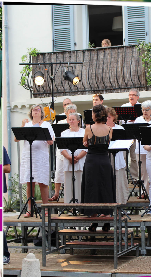
1ère édition du Festival des Chora Vocale sur la Place de la Reinesse à l'ensemble du conservatoire de