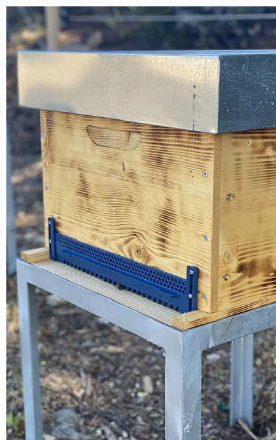
L'une des 4 ruches

La question de l'approvisionnement en eau des plantations a également été traitée avec la réfection complète d'un bassin de 150m 3 laissé à