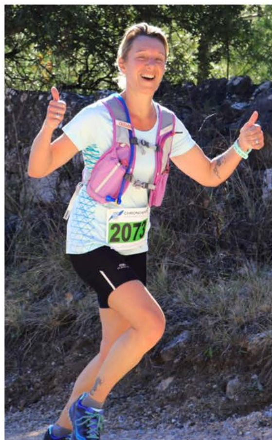
Sur les sentiers de la Foulée Flayoscaise

Le projet sera décomposé en trois parties