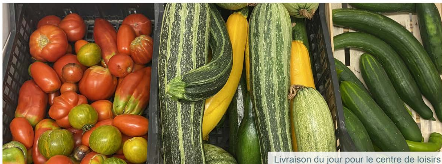
Livraison du jour pour le centre de loisirs