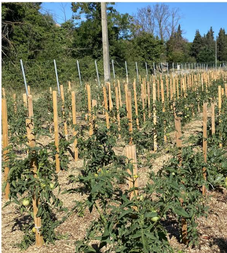
Au total, 600 plants de fruits et légumes d'été

Tout cela dans l'objectif de créer un jardin entièrement géré par les services techniques municipaux.